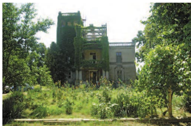
Conacul Cetate, în perioada interbelică și azi / “Cetate” mansion, in inter-war period and today