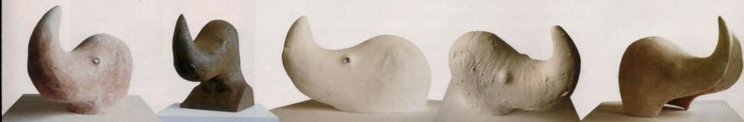
Decupajul variat al modului animalier și amplasamentele inopinate de detalii rinocerești dau tonicitate lecturii spațiale prin elipse perfect expresive. Rino-Cerul lui Răduță, cu al său multiplicat corn-al-lunii-albe, poate fi o bună imagine plastică pentru „osul vidului” din teoria cuantică a neantului. Aurelia Mocanu – critic de artă

de sfera social-umanului. Lucrările, în general, se subordonează unor concepții bazate pe serii de antonime, relația fragilitate-putere sau ordine-haos, care se valorizează reciproc. Această dualitate face referire la aspectul social, dar lasă loc mai multor decodificări și opinii”. Formele masive, puternice, masculine capătă o căldură aparte, o gingășie unică, surprinzătoare. Determină o adâncă meditație asupra barierei atât de fine între percepția artistului și felul în care reacționează privitorul. Tocmai reacția personală dă măsura valorii, felul în care fiecare se regăsește în culori, în patina fină a materialului. Forma ocupă un loc în spațiul emoțional, degajă lumină, prospețime, tinerețe, o permanentă regenerare, fără să impună o declarație dură, irevocabilă.